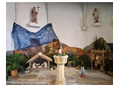
Crèche de Gannat 2024

Installée dans les maisons au pied du sapin et dans les églises, la crèche exprime le sens de la fête de Noël et le mystère de la naissance de Jésus. Elle nous rappelle, tout simplement, le message d'amour de Dieu pour nous.