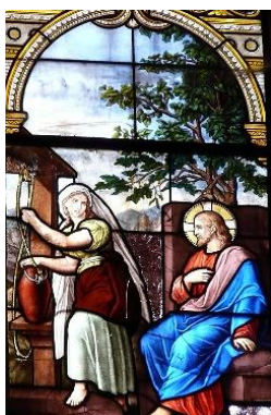
Vitrail de l'église de Châtillon sur Seine,