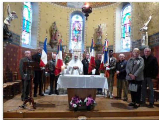
Abbatiale Saint-Léger et loto à Ébreuil. Église Saint-Bonnet.

Après avoir contribué au remplacement des chaises en 2022, l'association a financé tout récemment la rénovation et la réparation des contre-portes. Pour adhérer à l'association : Michel Bonnefille - 4 route des Colettes - 03450 Ébreuil - Tél : 04 70 90 75 41 ou 06 82 82 84 41