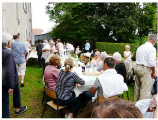
Repas du 15 août

Plusieurs événements ont eu lieu cet été à Banelle, dont la messe paroissiale du 15 août, suivie d'un repas très convivial préparé par le Père Élias.