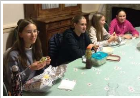
L'heure du pique-nique