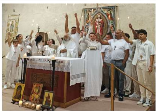
Première communion à Banelle